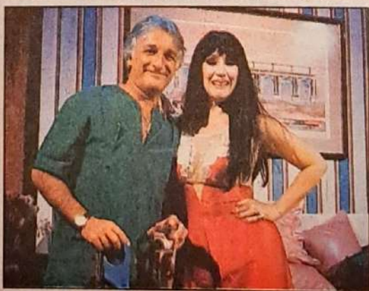
La artista argentina y su interesante invitado de anoche.